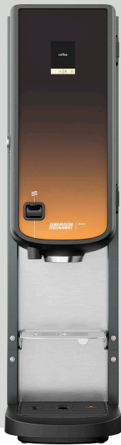
Bolero 11 met heetwateraftap